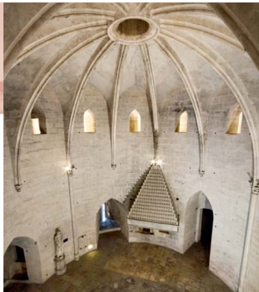
La salle voutée de la Tour de Constance