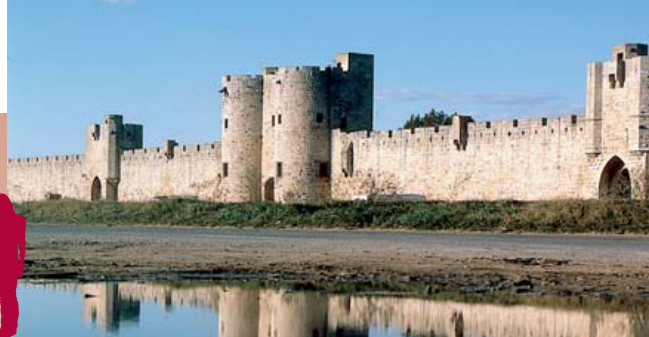
D'imposants remparts ceignent la ville