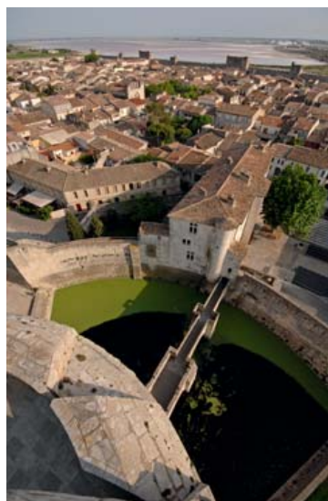
Vue des remparts